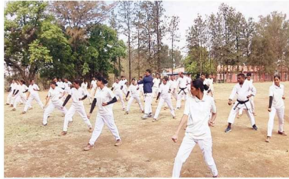
पांढरकवडा •६. सिंहदोष

येथील यवतमाळ जिल्हा कराटे असोसिएशनच्या तज्ज्ञ व अनुभवी कराटे प्रशिक्षकांनी चिखलदरा येथील वन प्रशिक्षण संस्थेच्या इतिहासात पहिल्यांदाच प्रशिक्षणार्थी वनरक्षकांसाठी विशेष कराटे आणि आत्मसंरक्षण शिबिराचे आयोजन करण्यात आले. वन प्रशिक्षण संस्थेत ४७ अप्रशिक्षित वनरक्षकांना दिलेले आत्मसंरक्षणाचे विशेष प्रशिक्षण यशस्वीरीत्या पूर्ण झाले. दि. २८ मार्च रोजी पार पडलेल्या दिमाखदार दीक्षांत समारंभाने या प्रशिक्षण सत्राची अधिकृत सांगता झाली. चिखलदरा येथील वन प्रशिक्षण संस्थेत १ ऑक्टोबर २०२५ पासून 'पायाभूत प्रशिक्षण सत्र क्रमांक ६३' राबविण्यात येत होते. या सत्राचा महत्त्वाचा भाग म्हणून १६ मार्च ते २६ मार्च २०२६ या १० दिवसांच्या कालावधीत वनरक्षकांसाठी विशेष कराटे शिबिराचे आयोजन करण्यात आले होते. या प्रशिक्षणासाठी कराटे या विषयात महाराष्ट्रातील पहिली पीएचडी (PhD) प्राप्त करणारे प्रसिद्ध कराटे प्रशिक्षक